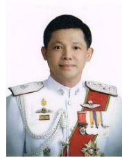
พลตำรวจเอก พงศพัศ พงษ์เจริญ โฆษกคณะกรรมการ