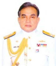
พลเรือเอก สุรศักดิ์ หุ่นเรืองรมย์ กรรมการและที่ปรึกษา