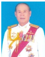
พลตรี จาริก อารีราชการณย์ กรรมการและที่ปรึกษา