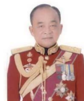
พลเอก อีระวัฒน์ บุญยะประดับ กรรมการ