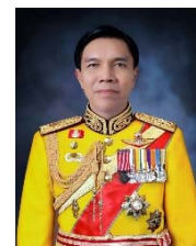
พลเอก วีรณ ฉันทศาสตร์โกศล กรรมการและที่ปรึกษา